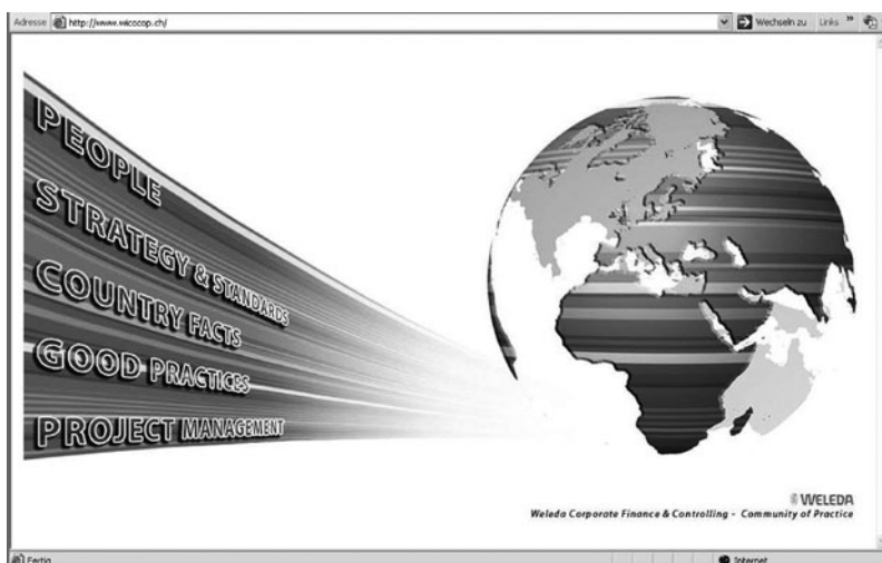
Die von der FFHS entwickelte CoP erleichtert die länderübergreifende Zusammenarbeit der Mitarbeitenden von Weleda.

zienten Wissensaustausch. Themen und Herausforderungen können dank der Plattform gemeinsam angegangen werden. Im Falle von Weleda wird das internationale Controlling durch die CoP für alle Beteiligten transparenter. Denn diese stehen nun in ständigem Kontakt und können Informationen auf formeller und informeller Ebene austauschen. Das Controlling, in dem periodisch Informationen zusammengestellt werden müssen, ist grundsätzlich eine eher stressbelastete Disziplin, denn meist kommen die Informationen erst im letzten Moment zustande. Die CoP ermöglicht es den Mitarbeitenden von Weleda, viel stressfreier zu arbeiten. Wenngleich sich die CoP derzeit noch in der Wachstumsphase befindet, zeigen die Aktivitäten bereits jetzt, «dass ein neuer Schwung entsteht, der sich positiv auf die Zusammenarbeit innerhalb des Unternehmens auswirkt», so Projektleiter Willi Bernhard.